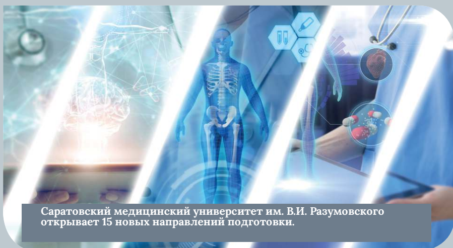
Саратовский медицинский университет им. В.И. Разумовского открывает 15 новых направлений подготовки.