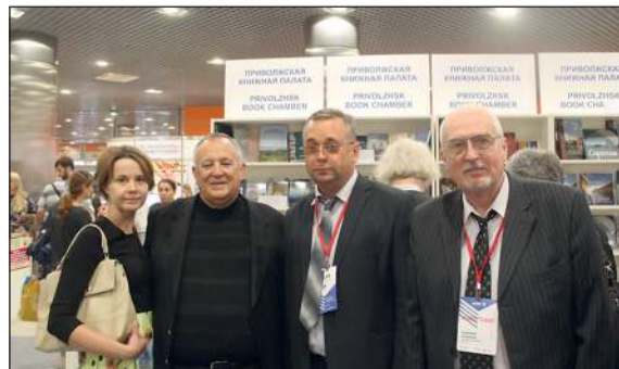
Отдел по изданию учебно-методической и научной литературы

В рамках выставки также состоялась заседание жюри всероссийского конкурса «Книга Победы». Были отобраны лучшие книги всех издательств, посвященные 70-летию Победы в Великой Отечественной войне. Их выставка, подготовленная совместно с китайскими партнерами, была представлена гостям ММКВЯ.