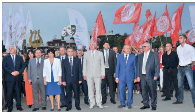
Отдел по связям с общественностью

От имени Совета ректоров саратовских вузов